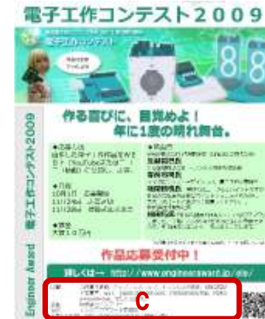
図3 告知チラシ(約1万枚)