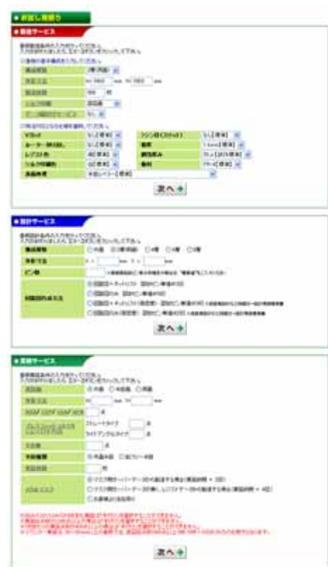
「P板.com」お試し見積りページ